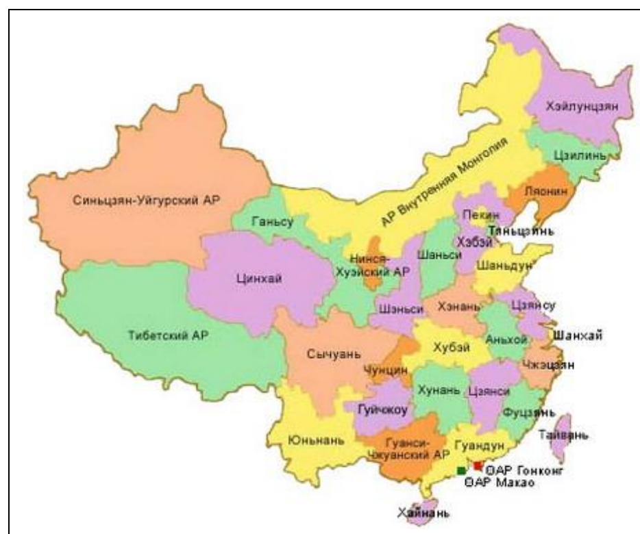
Карта административно-территориального деления КНР.