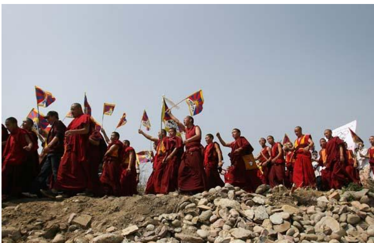
«Тибетский мятеж» 2008 г.

Как и в середине прошлого века, религия играет здесь далеко не второстепенную роль. В 2008 г. т.н. «тибетский мятеж» начался именно благодаря монахам, отмечавшим годовщину изгнания Далай-ламы. Радикализация ислама в СУАР всё чаще имеет следствием теракты, география которых до недавнего времени расширялась.