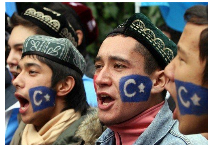
Уйгурские мусульманские сепаратисты в СУАР.

Сейчас власти КНР делают заявления, согласно которым они будут всячески бороться с этническим сепаратизмом, однако также обязуются поддерживать мирное развитие нацменьшинств, сохранять их культуру и верования. Важнейшим инструментом интеграции считается также развитие инфраструктуры: активное строительство транспортной сети, социальных объектов, развитие промышленности, по мнению чиновников в центре, должно крепко связать АР с Китаем. Важнейшим для Китая проектом является инициатива «Один пояс — один путь» (и дай и лу, «один пояс — один путь») [The National Development and Reform Commission..., 2015] 4 , одна из трасс которого проходит именно через СУАР, хотя очевидно, что определенная нестабильность